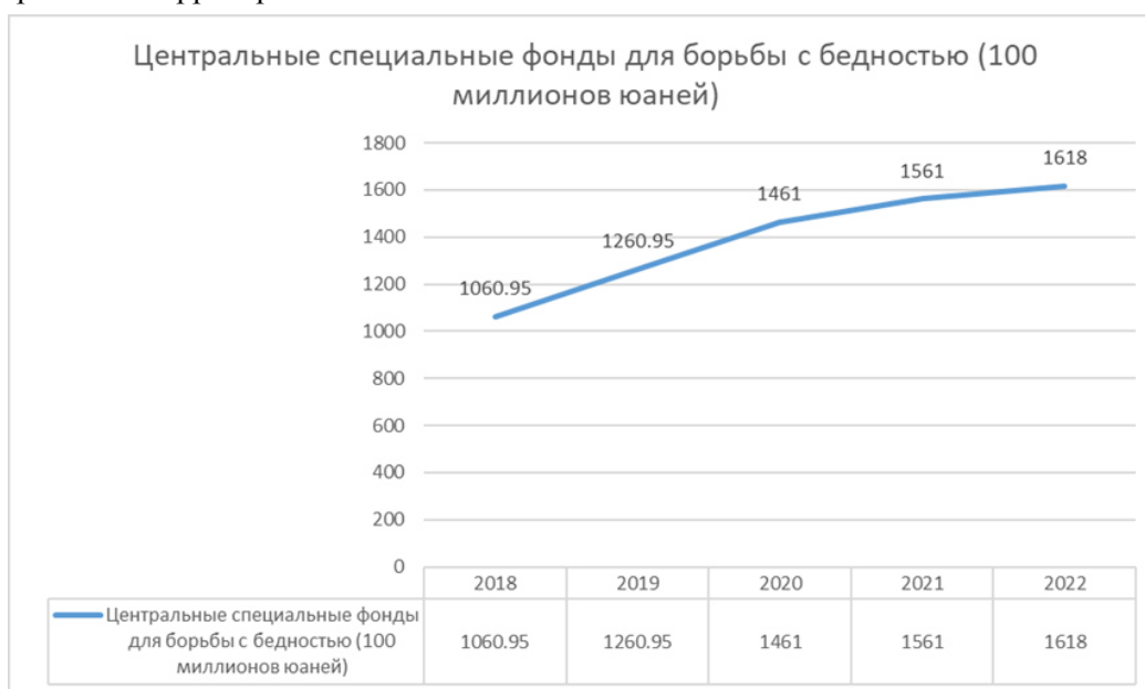
Рис.2. Динамика центральных специальных фондов для борьбы с бедностью, 100 млн. юаней.

К 2022 г. объем специальных фондов Китая по борьбе с бедностью достиг 161,8 млрд. долларов. С поэтапными достижениями Китая в борьбе с бедностью инвестиции в специальные фонды показали общий рост, хотя рост снизился. Однако Китай намерен продолжить наращивать усилия по борьбе с бедностью и построению в стране благополучного общества. В то же время становится понятным, что необходимо усилить поддержку строительства инфраструктуры, образования и медицинского обслуживания в бедных районах, чтобы обеспечить здесь лучшие условия жизни населения и возможности для развития территорий.