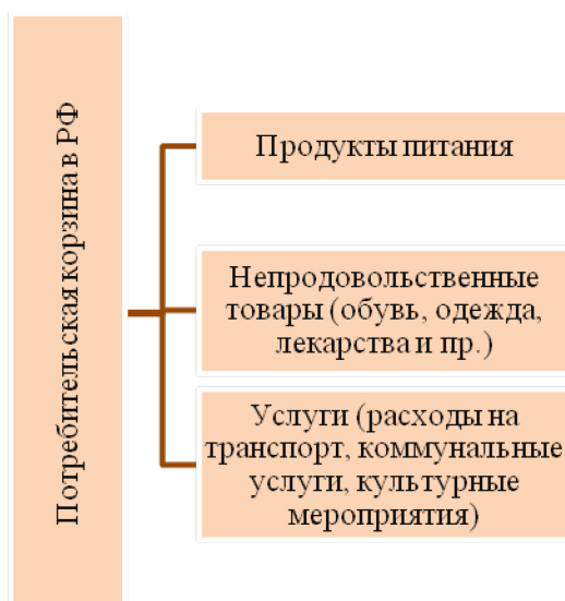
Рис. 1. Категории, входящие в потребительскую корзину РФ.

Потребительская корзина в России – это приблизительно рассчитанный набор товаров и услуг, необходимых для физиологического выживания человека. Российская потребительская корзина включает три категории, представленные на рис. 1.