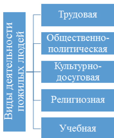
Рис. 1. Виды деятельности пожилых людей.

Исходя из данных, приведенных в таблице, можно сделать вывод, что с возрастом увеличивается число участников в различных организациях (движениях). Исключение составляет профсоюзные организации, в которых наибольшая доля участников – лица в возрасте 55-59 лет. Это объяснимо: как правило, в таком возрасте продолжается трудовая деятельность, и можно сказать, что участие в профсоюзе является частью трудового процесса. Также можно выделить виды деятельности данной социально-возрастной группы – трудовая, общественно-политическая, культурно-досуговая, религиозная (рис. 1).