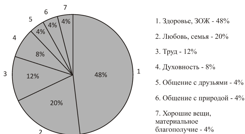
Рис. 1. Индекс отношения к здоровью.

Из полученных результатов видно, что здоровье и ЗОЖ как высшая ценность определяются у 48% опрошенных, 20% на первое место ставят семью, 12% – трудовую деятельность, 8% считают, что высшая ценность – духовное развитие и всего по 4% отдают предпочтение остальным жизненным ценностям. На рис. 1 представлено процентное соотношение выбранных ценностей школьниками.