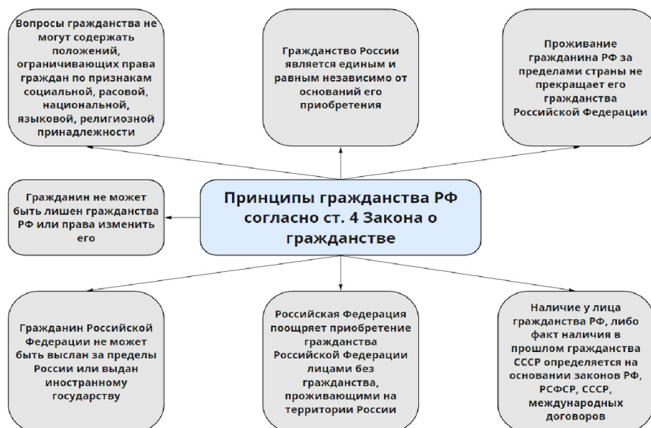
Рис. 2. Принципы гражданства.

В международном праве сложилась система принципов, регулирующих порядок и способы приобретения гражданства, а также определяющих правовой статус лиц без гражданства (рис. 2).