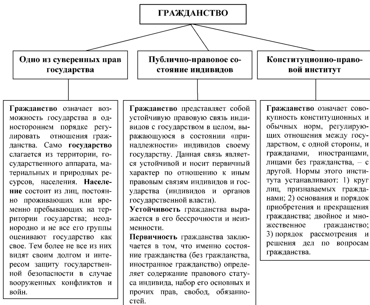
Рис. 1. Три аспекта сущности гражданства.

Гражданство – это правовой статус, правовое состояние лица по отношению к его государству, с которым человек имеет устойчивую политическую и правовую связь в виде совокупности своих взаимных прав и обязанностей [3] (рис. 1).