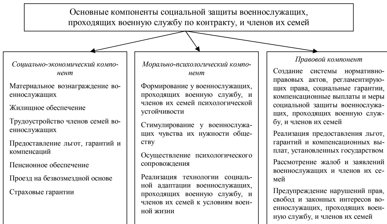
Рис. 1. Основные компоненты социальной защиты военнослужащих и членов их семей.

К объектам социальной защиты относят все категории военнослужащих и членов их семей. Социальная защита военнослужащих и членов их семей включает три компонента (рис. 1): 1) социально-экономический; 2) морально-психологический; 3) правовой.