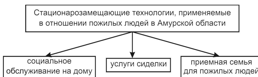
Рис. 1. Стационарозамещающие технологии, применяемые в отношении пожилых людей в Амурской области.

В Амурской области в рамках социальной работы с пожилыми людьми в данное время используются следующие стационарозамещающие технологии: социальное обслуживание на дому; услуги сиделки; приемная семья для пожилых людей (рис. 1).