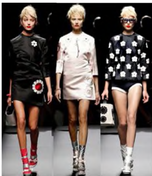
Рис. 2. Модели из коллекции Prada.