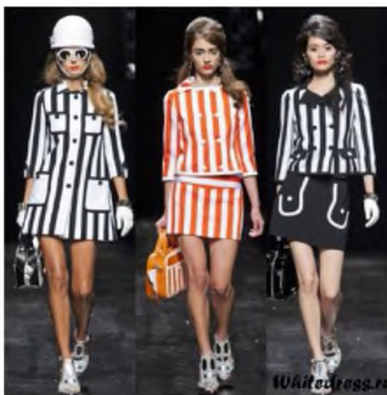
Рис. 3. Модели из коллекции Marc by Marc Jacobs и Moschino.