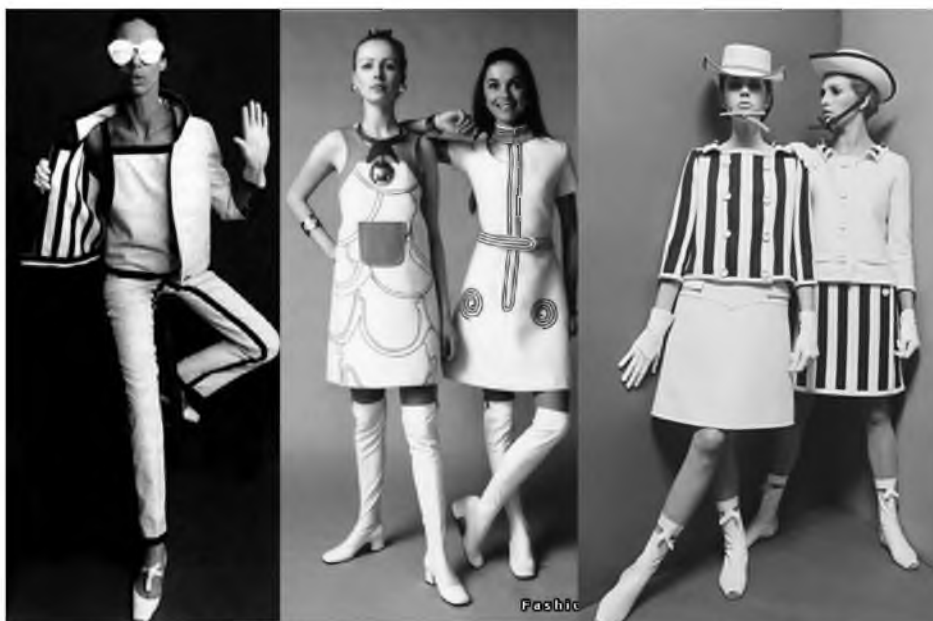
Рис. 1. Модели Андре Куррежа.

Во втором десятилетии XXI в. стиль 60-х стал одним из главных трендов в мире моды. Модели современных ведущих дизайнеров посвящены 60-м. Это причудливые вещи, соединившие модернизм Андре Куррежа и популярные явления моды: лаконизм геометрических силуэтных форм, пастельные флористические узоры (рис. 1). Вновь актуальны в ассортименте женской одежды мини-юбки, платья с завышенной талией, платья силуэта «трапеция», короткие яркие пальто, рисунок «горох», сумки-портфели, элегантные костюмы (рис. 2-3).