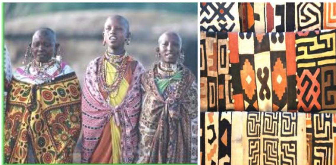
Рис. 3. Одежда народов Танзании.

Основная часть населения Танзании предпочитает хлопковые «отрезы», сшивать которые не нужно (рис. 3). Существует несколько видов таких «отрезов». Самый распространенный называется kanga . Именно он является излюбленным атрибутом одежды у многочисленного народа суахили, проживающего в Танзании, особенно у женской его части. Чаще всего носят сразу две канги. Один отрез завязывают в виде юбки, второй используют как накидку [6].