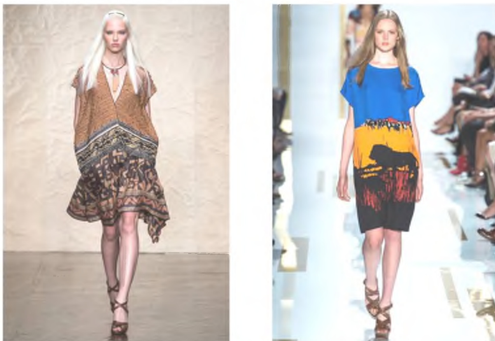
Рис. 1. Этнические мотивы в коллекциях модных домов 2014-2015 гг.