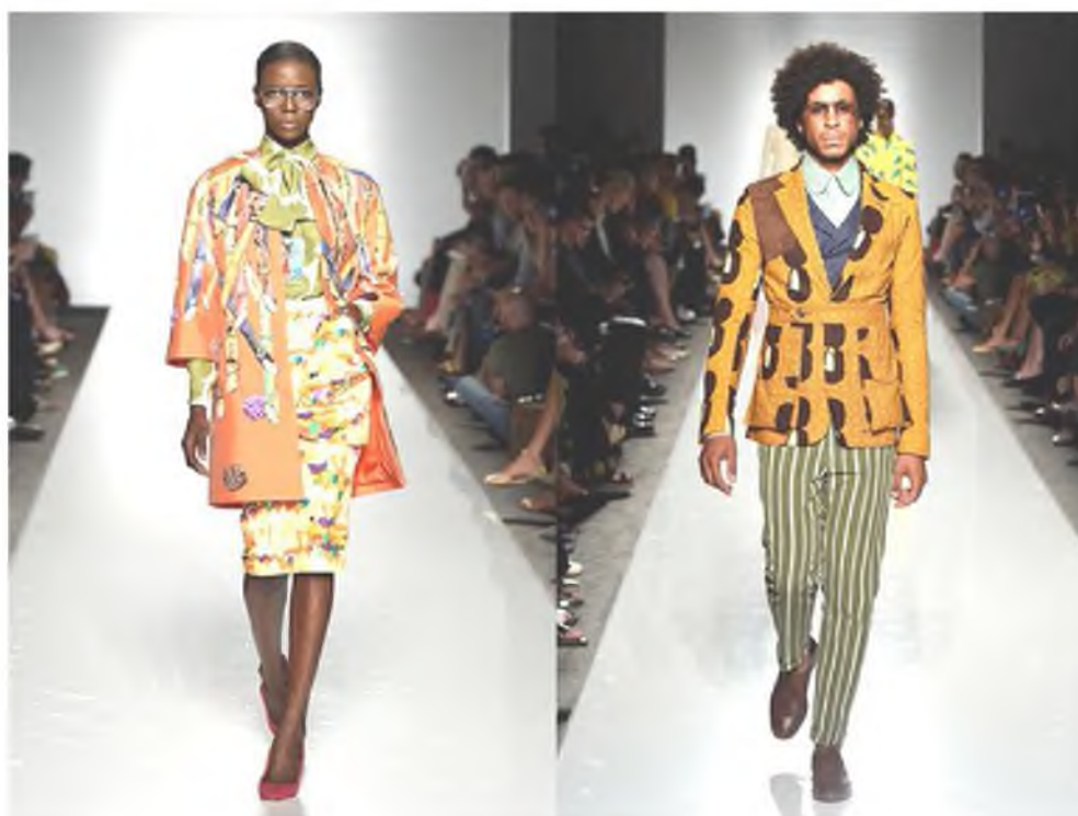
Рис. 2. Модели Stella Jean.

Однако Африка в сознании среднего неафриканца предстает единой частью мира, без деления на страны и народы. Правда, «продвинутые» европейцы способны выделить арабскую часть Африки. И лишь немногие из нас догадываются, что национальный состав Африки такой же пестрый, как и орнаменты одежд ее жителей. Кстати, как раз по одеждам африканцы и узнают, кто откуда родом.