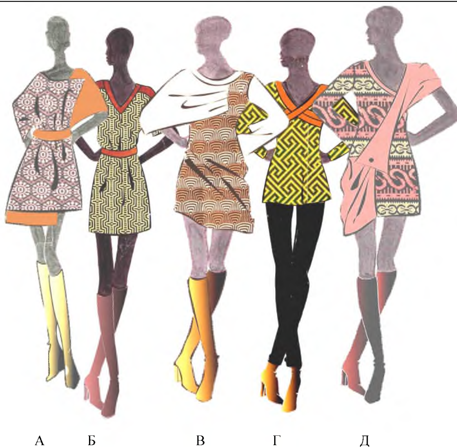
Рис. 6. Коллекция трикотажной одежды с элементами этностиля.

На рис. 7 представлены: графический символ «паучья сеть» (рис. 7а); образец, выполненный жаккардовым переплетением (рис. 7б) и патрон рисунка (7в).