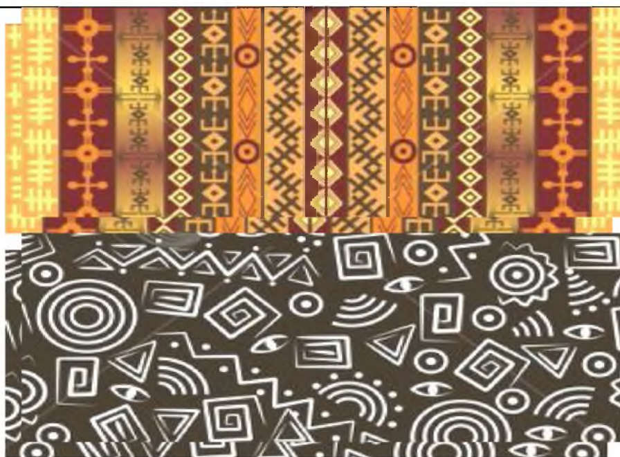
Рис. 5. Нанесение символов на цветную и черно-белую ткань.