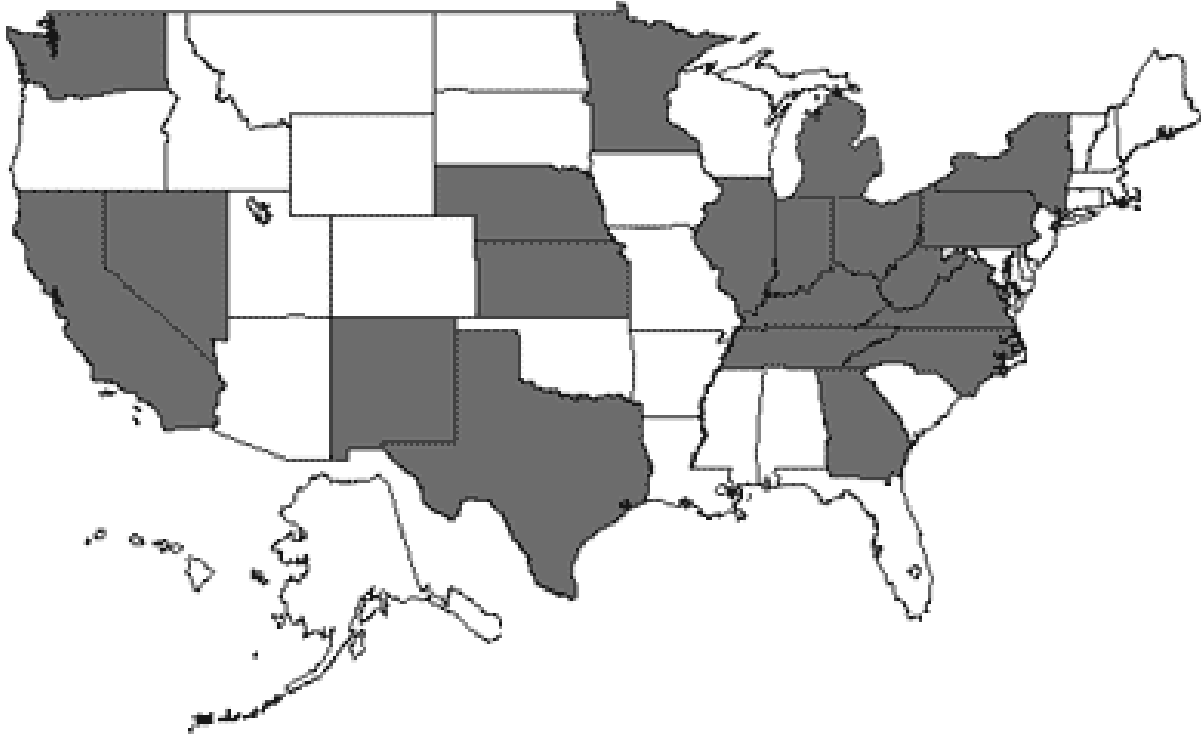
Рис. 2. Штаты, в которых поднималась тема Китая в ходе выборов 2010 г. (выделены темным).

Разумеется, накал дискуссий лишь усилился в ходе выборов 2012 г. Традиционно Китай подвергается острой критике со стороны оппозиционного кандидата. При этом кандидат от республиканцев Митт Ромни, не обладая знаниями о Китае, часто выступает с прямо противоположными оценками. Одной из наиболее острых тем в критике Обамы с его стороны в последние месяцы стали недостаточно активные действия по защите национального рынка от китайского демпинга. Однако еще два года назад Ромни сокрушался: «Действия президента Обамы по защите американских производителей автопокрышек от иностранных конкурентов... крайне негативны для страны и для наших рабочих. Протекционизм душит производительность» 7 .