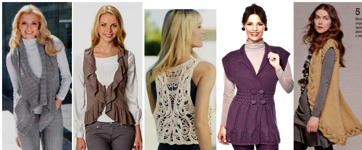
Рис.12. Модные женские вязаные жилеты.

Вязаные жилеты застегивают на пуговицы, часто изготавливают без застежки или фиксируют на груди или на талии завязками. Края жилета могут быть оригинально украшены объемными оборками, кружевными или плетеными в виде косы бейками (рис. 12).