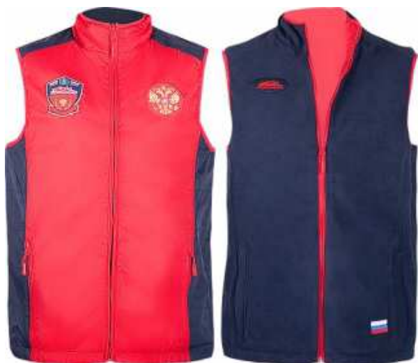
Рис. 7. Спортивные жилеты

жилетах можно бегать, прыгать, играть, использовать их в воде, обязательно регулируя нагрузку, в зависимости от вида тренировки. Также они нужны для силовой подготовки, так как за счет дополнительного веса включается больше мышц и тренировки становятся более эффективными (рис. 8). В качестве утяжелителей-грузиков служат металлические стержни, помещаемые в карманах [5].