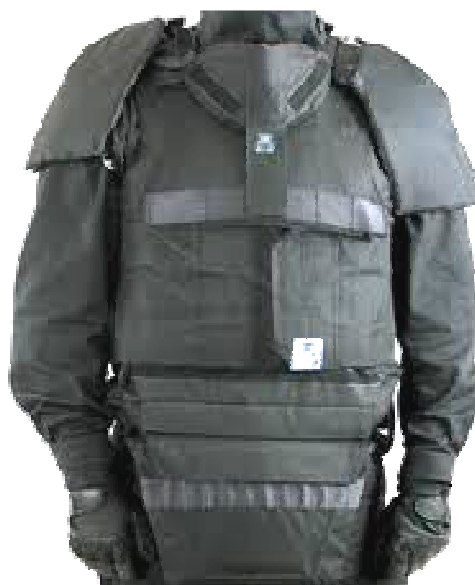
Рис. 4. Бронежилет ФОРТ «Росич», отличающийся высокой пулестойкостью и площадью защиты до 70 кв. дм.

военнослужащих , в основном стрелков пехоты ( воздушно-десантные войска , морская пехота ). Он имеет большое количество специальных карманов, предназначенных для комфортного ношения оружия, магазинов к нему, гранат и ряда других предметов (фляги, медицинский пакет, аптечка и т.п.