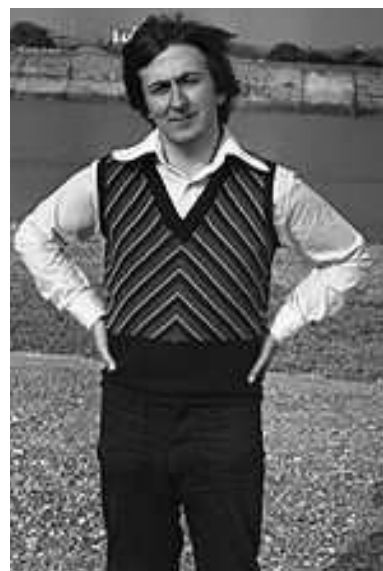
Рис. 2. Жилет-безрукавка.

Сегодня жилет используется в совершенно разных вариантах – это и составная часть классического мужского костюма-тройки , и утепленный вариант, альтернатива свитеру . Кроме этого, начиная с XX века, жилет стал широко использоваться как специальная одежда или даже обмундирование (рис.3, 4) [1, 2].