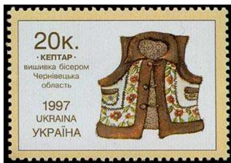
Рис. 1. Изображение кептара на почтовой марке Украины.

Жилет в течение своего существования неоднократно менял внешний вид, однако примерно к середине XIX в. он приобрел те форму и фасон, которую сохраняет до наших дней. Кстати, именно в этот период жилеты начали носить не только мужчины, но и представительницы