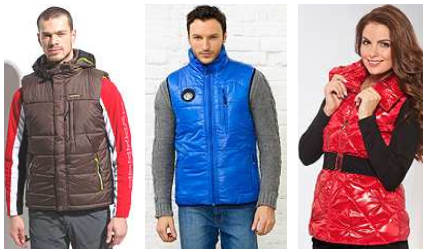
Рис. 6. Модные практичные, дутовые (стеганные) жилеты с застежкой-молнией.

Очень популярны дутовые жилеты, которые надевают, когда катаются на лыжах и коньках, на прогулку при холодной погоде, а также женственные стеганные жилеты (рис. 6) [3].