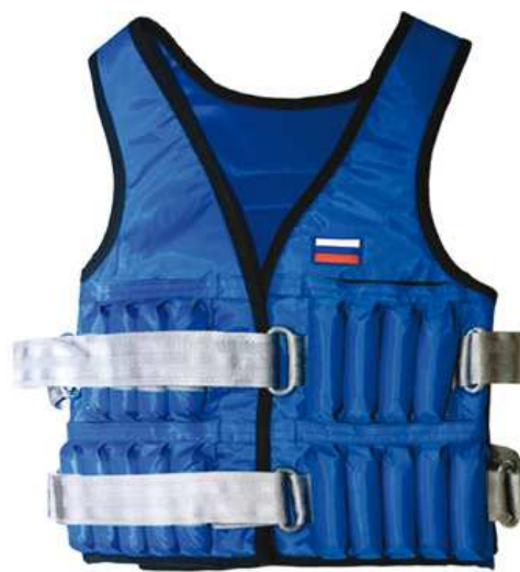
Рис. 8. Жилет-утяжелитель