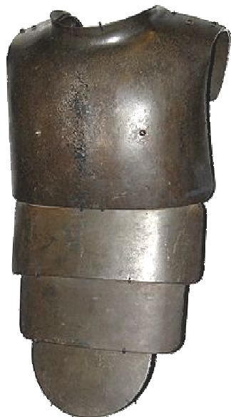
Рис. 3. Немецкая кираса Infanterie-Panzer 1917 г., Первая мировая война.

Разгрузочный жилет (тактический жилет) – элемент снаряжения (экипировки)