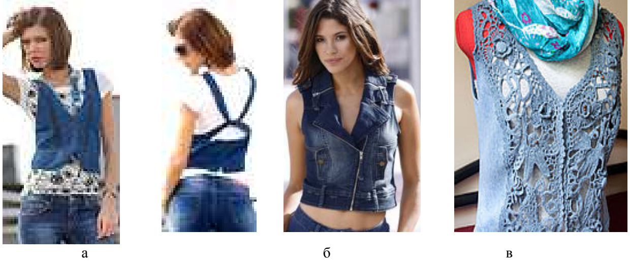
Рис. 11. Джинсовые жилеты: а – с застежкой на пуговицы и оригинальным оформлением сзади; б – в стиле «байкер» с застежкой на молнию; в – с вышивкой ришелье на средних частях полочек.

В новом сезоне модная индустрия предлагает ярким и эксцентричным особам широчайший ассортимент красивых и стильных женских джинсовых жилетов от мировых производителей: Apart, Mondigo, MEXX, DIESEL, Heine, Elegance и др.