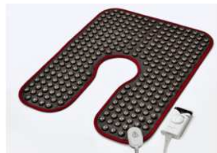
Рис. 10. Турманиевый жилет МНР-100.

Для восстановления работы опорно-двигательного аппарата, тренировки мышц, поддерживающих позвоночник, и удержания позвоночника в правильном положении применяются жилеты-тренажеры – ортопедические корсеты и корректоры осанки нового поколения (рис. 9) [6]. Используются жилеты и в других медицинских целях, – например, турманиевый жилет МНР-100 – удобный многофункциональный физиотерапевтический прибор, предназначенный для профилактики и лечения самых различных заболеваний (рис. 10). К жилету можно прибегнуть просто для того, чтобы быстро согреться после пребывания под дождем или на морозе. Лицевая сторона турманиевого жилета выполнена из велюра с красивым узором, а в качестве подкладки использована приятная на ощупь гипоаллергенная ткань. Покрой жилета позволяет надевать его людям с любой фигурой. Изделие прекрасно держит форму благодаря вшитым в край прочным силиконовым шнурам [7].