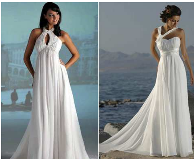
Рис. 7. Свадебные платья в стиле «ампир».

Современный вариант ампирного стиля в одежде – «baby doll» – укороченные, коктейльные платья с завышенной талией, создающие кукольный и наивный образ. Однако baby doll уступает место классическому ампиру. Платья в пол, легкие и воздушные, с завышенной талией и нежной ленточкой под грудью создают не менее (а может, и более) чарующий образ, сочетающий невинность и сексуальность, строгость и роскошь, классику и современность. Отдавая должное стилю ампир, отметим, что о