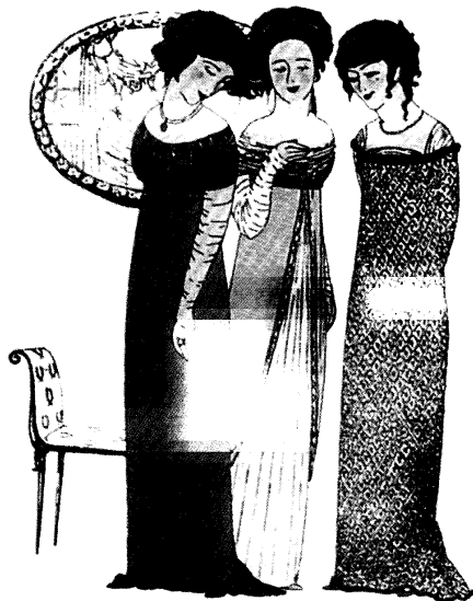
Рис. 4. Иллюстрация из альбома «Платья Поля Пуаре, увиденные Полем Ирибом». 1908 г.

Первым модельером нового, XX в. и выдающимся реформатором женского костюма был француз Поль Пуаре. Начиная с 1907 г. мастер предлагал клиенткам соблазнительные платья в стиле Директории, Консульства и Империи. Они не требовали использования жесткого длинного корсета, превращавшего женскую фигуру в подобие песочных часов и придававшего телу S-образный изгиб. Теперь юбки падали прямыми стройными складками: у вечерних платьев – по-прежнему до самой земли, у прогулочных и визитных – до щиколотки. Линия талии сместилась под грудь, что позволяло создать более цельный образ, сгладить переходы от одного объема к другому (рис. 4). Пуаре заставил модниц отказаться от шуршащих нижних юбок, украшенных вышивкой, мережкой и кружевами.