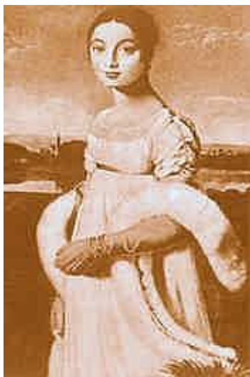
Рис. 2. Жан Огюст Доминик Энгр. Мадемуазель Каролина Ривьер. 1805 г.

драгоценных камней. Из украшений к нарядам в стиле ампир выбирали жемчуг (искусственный и натуральный), камеи, перстни, кольца и ожерелья, которые оборачивали вокруг шеи несколько раз, множество браслетов (и на ногах, и на руках), диадемы и серьги с подвесками [8].