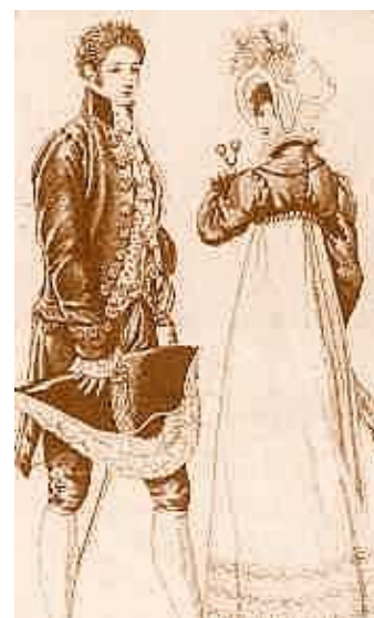
Рис. 3. Платье периода Реставрации.

Исторический анализ возникновения стиля ампир в одежде показал, что основными чертами женских платьев в начале XIX в. были глубокие вырезы лифа, завышенная линия талии, длинный подол со складками, который переходил в шлейф, рукав-фонарик с широкой манжетой. Ткань для платьев выбирали шелковую или прозрачную тонкую, под которую шилась подкладка из плотного шелка. Постепенно в отделке платьев появлялись разнообразные орнаменты, вышитые гладью серебряной или золотой нитью. Спустя некоторое время шлейф исчез, подол становился все короче, открывая сначала туфли, а потом и щиколотку, декольте – менее глубоким.