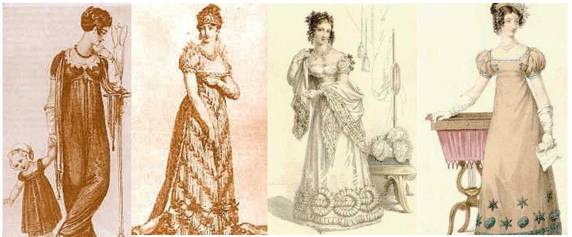
Рис. 1. Платья в стиле ампир. XIX в.

Силуэт требовал сохранения античного величия и стройности, поэтому к концу первого десятилетия XIX в. возвращаются корсеты. Шлейф, создаваемый кроем, придававший фигуре больше изящества и подвижности, вскоре исчез – согласно императорскому указу его имели право носить только принцессы. Самая характерная форма рукава – фонарик, даже длинный и узкий рукав заканчивался фонариком у плеча. Появляется новый фасон – мамелюк: широкий рукав, собранный в нескольких местах лентами [4, с. 190]. С одеждой в стиле ампир носили кожаную обувь без каблуков [8].