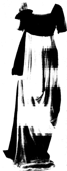
Рис. 5. Модель Мариано Фортуни «Delphos». 1920

Фортуни Мариано (1871-1949) – дизайнер по текстилю и костюму – в своих работах не раз возвращался к стилю ампир. В 1906 г. под влиянием искусства Киклад выполнил «кносский» шарф из шелковой вуали. Употреблял его то в качестве головной повязки или тюрбана, то пояса, в частности для своего знаменитого наряда «Дельфос» (рис. 5), напоминавшего дорическую колонну цилиндрической формой, образованной плиссировкой (запатентованной в 1909 г.). Создал версии «Дельфоса» с рукавами и без них, с поясом на талии. Туалеты Фортуни выглядели еще более эффектно в движении. Айседора Дункан была одной из самых знаменитых клиенток мастера [1, с. 363-364].