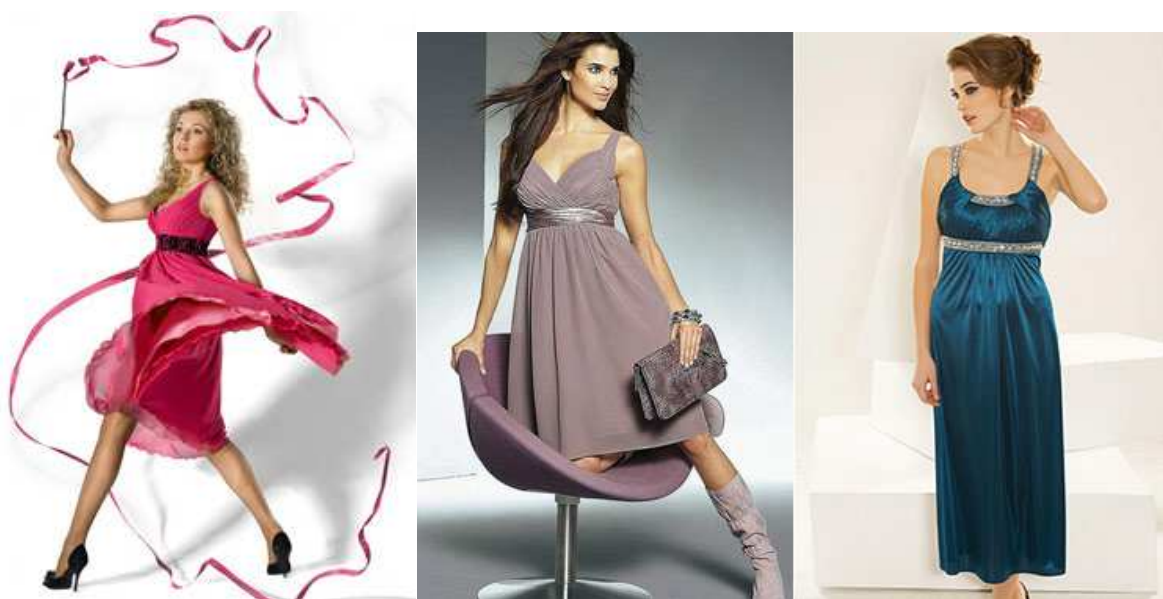
Рис. 6. Современные платья в стиле ампир.

Сейчас легкие сарафаны, юбки и платья из воздушных струящихся тканей занимают достойное место в гардеробе модниц (рис. 6). Завышенная талия – современное воплощение ампирного стиля в одежде – создает грациозный силуэт, при этом выгодно скрывая всевозможные недостатки. Платья и сарафаны с завышенной талией, отличающиеся особой воздушностью и легкостью, удлиняют фигуру, зрительно делают ее более стройной. Современные платья в стиле ампир прекрасно подходят практически каждой девушке. В таком наряде субтильные модницы с мальчишковой фигурой обретают более плавные, женственные формы. Девушки невысокого роста кажутся чуть выше. Пышным красавицам предоставляется возможность выгодно подчеркнуть все достоинства своей фигуры, – к примеру, роскошную линию бюста, – и, возможно, скрыть пару лишних килограммов. Благодаря своей универсальности платья в стиле ампир спустя столетия вновь находятся на пике моды.