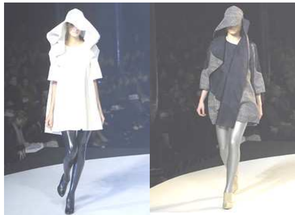
Рис. 2. Модели, созданные на основе источника творчества – архитектуры.