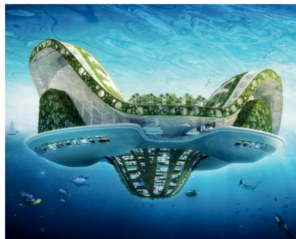
Рис. 5. Здание в воде – будущая постройка Дубая.