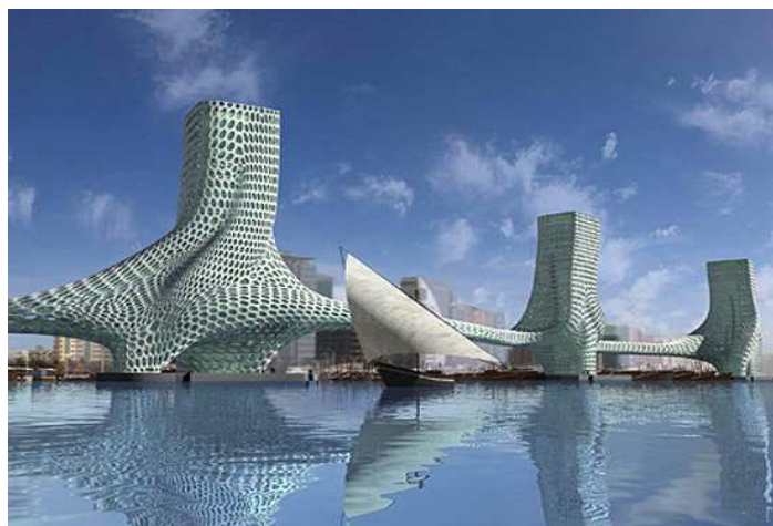
Рис. 4. Вид набережной Дубая.