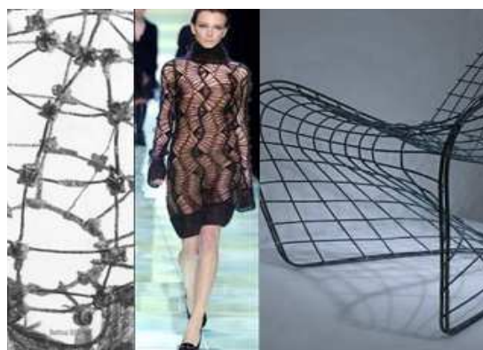
Рис. 1. Отражение архитектурных сооружений и окружающих предметов в