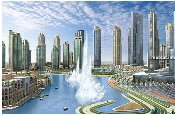
Рис. 6. Дневное изображение проекта фонтана в Дубае.