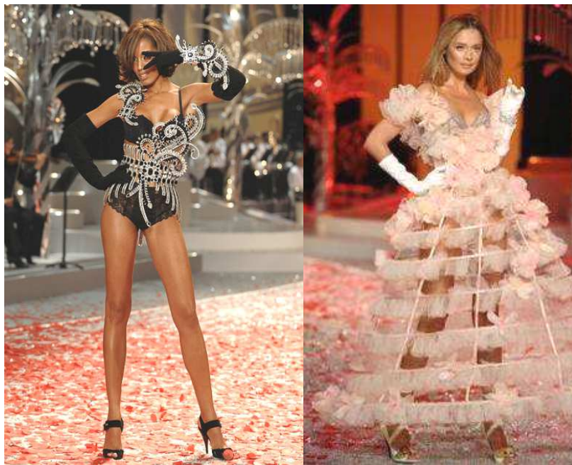
Рис. 8. Модели, созданные на основе источника творчества – водопад.