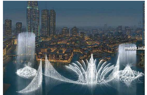
Рис. 7. Ночное изображение проекта фонтана в Дубае.