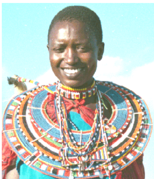
Рис. 4. Ожерелья масайских женщин.

Золото масаи презируют, поэтому материалом для украшений служат бисер, кости, простой металл, стекло и т.д. Из них изготавливают довольно сложные конструкции на голову, шею, грудь и в уши.