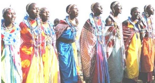
Рис. 3. Одежда женщин масаев.

Одежда – отнюдь не самое важное в костюме масаев. Женщины этого народа носят на шее знаменитые на весь мир массивные украшения из проволоки и бисера, которые со временем значительно удлиняют шею, что у масаев считается первым признаком женской красоты. Считается также, что женские руки масаев созданы для того, чтобы быть украшенными бесчисленными браслетами (рис. 3, 4).