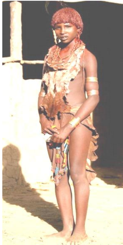
Рис. 2. Женщина племени Хамер.

мени выделяются всепоглощающей заботой о своей внешности. Они очень любят украшать и разрисовывать себя. Каждое украшение и орнамент на теле имеет важное символическое значение. Женщины племени носят ритуальные передники – фаланги из расшитой бисером кожи. Широкий металлический ошейник с ручкой на шее – почетный знак первой жены. Остальные избранницы того же мужчины носят ошейники без ручек, по количеству же ошейников можно определить порядковый номер жены (рис. 2). Мужчины этого племени носят передники из ткани или кожи и украшают себя всевозможными браслетами, ожерельями и серьгами [4].