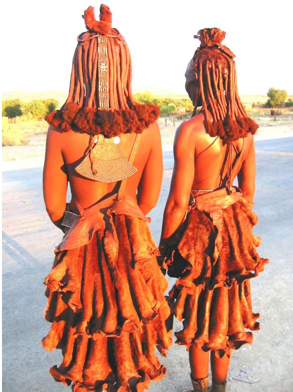
Рис. 1. Женщины племени Химба.

Одно из самых колоритных племен Восточной Африки – Масаи , населяющее Танзанию и Кению в районах, где доминирует гора Килиманджаро. По культуре, образу жизни, менталитету, мироощущению они довольно-таки сильно отличаются от других окружающих их народов. Гордые и свободолюбивые, они стараются жить в полном единении с природой, почитая себя высшим народом Африки [5].