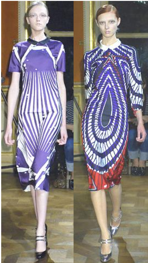
Рис. 5. Модели из коллекции Miu Miu (весна/лето 2007 г.).

гамма также выдержана в природных тонах: цвет песка, земли, огня и т.п.