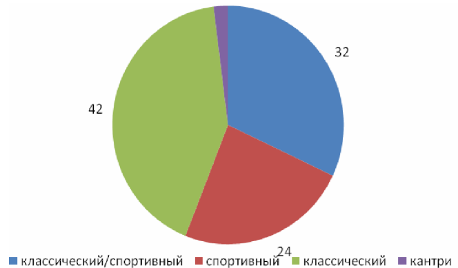
Рис. 2. Вариант стиля школьной формы.