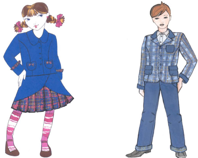
Рис. 3. Вариант стиля школьной формы.

ской одежде, были разработаны 15 эскизов комплектов школьной одежды для девочек и мальчиков младшего школьного возраста, представленные затем в рамках доклада на педагогическом совете детского дома №13 г. Свободного. По итогам совета были выбраны три модели комплектов для девочек и мальчиков. В качестве ведущих моделей комплектов одежды для школы были утверждены модели, представленные на рис. 3.