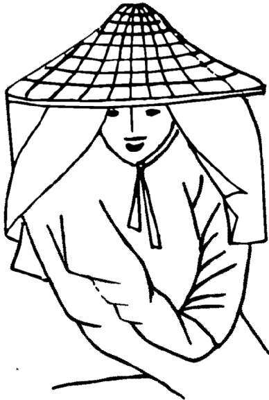
Рис. 4. Соломенная шляпа (цао мао, ли).

Старинной одеждой являлись и длинные, довольно широкие шелковые или хлопчатобумажные штаны. Сельские жители завязывали их на щиколотках. Головной убор (только у мужчин) – соломенная шляпа (рис. 4), простая головная повязка из черного газа, которую со временем стали пропитывать лаком. Мужские прически всегда состояли из узла длинных волос, укрепленного на темени шпилькой. Еще в старину у мужчин существовал обычай отращивать волосы, носить косу, он частично сохранился к началу XX в., но лишь в низших классах общества. Основным украшением древних костюмов мужчин были пояса и ленты. При династии Тан был установлен «Порядок поясов». Количество и материал украшений, навешивавшихся на пояса, определялись рангом чиновника. Чиновники ниже первого ранга украшали пояс ножами и отполированными камнями «лиши». Канцелярские и военные чиновники третьего ранга и выше носили пояса с нефритовыми подвесками, чиновники четвертого и пятого рангов – с золотыми подвесками, шестого и седьмого рангов – с серебряными. А простолюдины могли использовать только медные подвески и железные ножи.