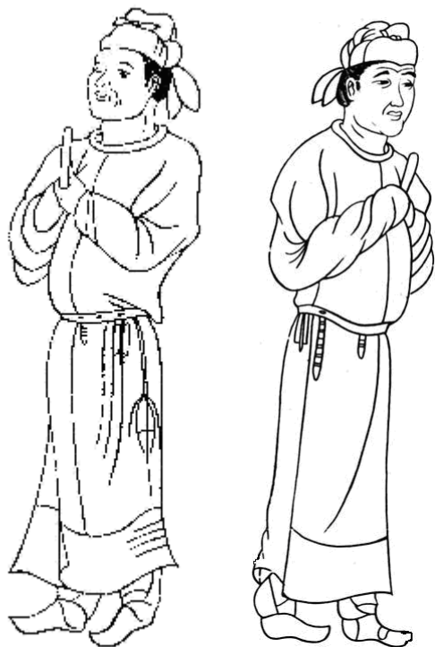
Рис. 1. Китайские мужчины в эпоху Тан.

на природную смуглость, белизну и румянец лица китайки ценили очень высоко. Поэтому белила и румяна были широко распространены в декоративной косметике. По описанию венецианского купца и дипломата Марко Поло можно судить, как высоко было развито в средневековом Китае чувство красоты. Выбирая, например, невесту для императора, ее красоту оценивали, как и бриллиант, на караты.