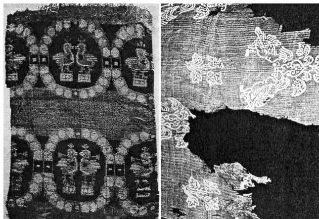
Рис. 2. Тканые цветные узоры в эпоху Тан.

Эпоха Тан является эпохой быстрого развития политики и экономики, эпохой расцвета культуры и искусства. Это время блеска и сияния феодальной культуры. Тан смогла объединить страну, вывести ее из того разрозненного и смутного состояния, в котором она была при Вэй, Цзинь и Южных и Северных династиях, создать сильное и процветающее государство. Торговля с другими странами развивалась, осуществлялся сильный рост производительных сил, довольно длительное время наблюдалось благоденствие страны и благосостояние народа. Время, когда Китай в эпоху Тан стал азиатским центром экономического и культурного взаимодействия разных народов, было одной из наиболее ярких и блистательных страниц китай-