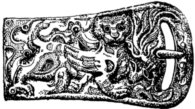
Рис. 6. Бронзовая пряжка, украшенная гравировкой, изображающей битву животных.

также подвешенные сбоку точило и сумочка. Наборный пояс – принадлежность воина, его неперемный атрибут. Количество бляшек и пряжек на поясе зависело от общественного положения воина. Бляшки были литые, часто с гладкой поверхностью, но в конце VIII в. н.э. появились и штампованные бляшки из тонкого листа, поверхность большинства которых покрывалась сложным орнаментом. Бляхи – оправы из бронзы, с прямоугольным отверстием для подвесного ремешка.