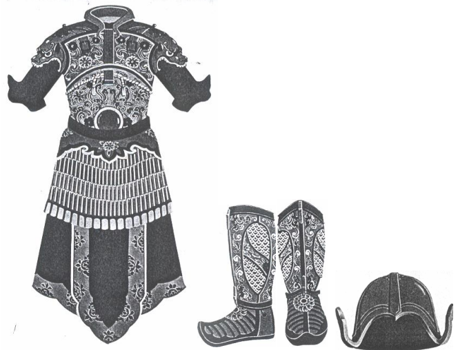
Рис. 5. Защитная одежда во время военных действий.

Всадники – военные должны были быть облачены в тот же степной костюм, приспособленный к жизни на коне (рис. 5), к быстрой езде и битвам, который существовал еще при династии Тан (618-907 гг. н.э.) и даже раньше, во время первых схваток с конными кочевниками. Это был короткий, плотно облегающий тело в талии кафтан с треугольными отворотами и узкими рукавами, удобный в бою, а также широкие, туго перехваченные внизу штаны. В талии фигура была перехвачена узким поясом, нередко с целым набором украшений, пряжек и бляшек (рис. 6). На поясе висел кинжал или сабля, иногда – и то и другое, а