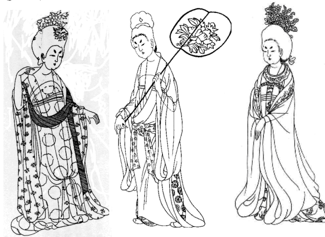
Рис. 3. Женские костюмы и украшения в эпоху Тан.

Женские костюмы и украшения эпохи Тан являются в истории Китая одними из самых выдающихся. Материал выбирали самый качественный, образы поражали великолепием и дополнялись роскошными украшениями (рис. 3).