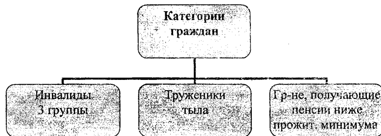
Рис. 3. Наиболее нуждающиеся в социальной поддержке жители района.

ды взамен натуральных льгот. Положительным аргументом является своевременная выплата ЕДВ.