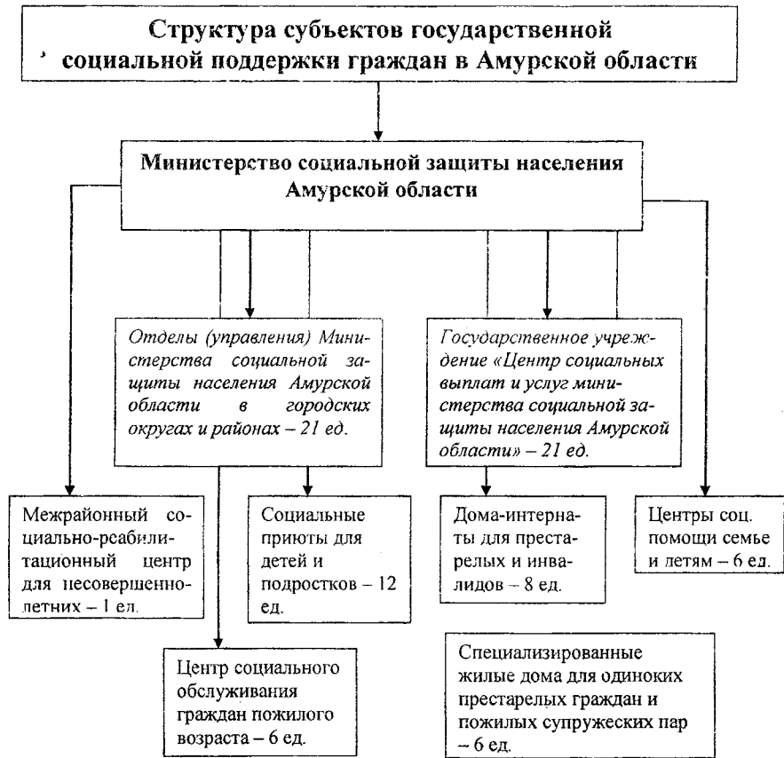
Рис. 1. Субъекты государственной социальной поддержки граждан в Амурской области.